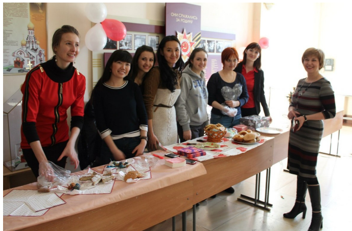
Во время проведения благотворительной акции

- На младших курсах, мы больше уделяли времени внеучебной деятельности,